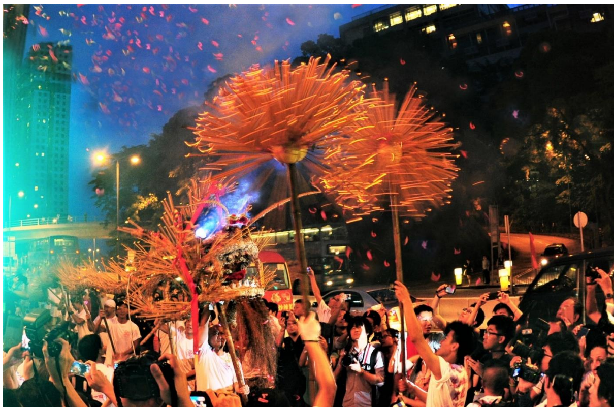
圖片 1 每逢中秋節晚上，薄扶林村村民均會舉辦舞火龍活動。據聞其歷史悠久，已有百年歷史，與大坑舞火龍同樣馳名香江。